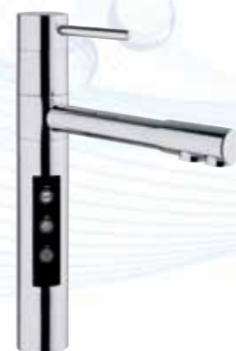
RUBINETTO ELETTRONICO A 5 VIE

REFRIGERATA; LISCIA; FRIZZANTE; CALDA E FREDDA