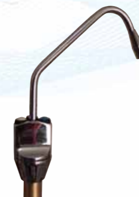
RUBINETTO ELETTRICO 12 V. A 3 PULSANTI