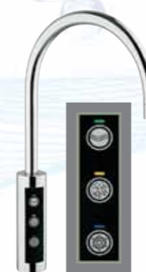
RUBINETTO ELETTRONICO A 3 PULSANTI

REFRIGERATA; LISCIA; FRIZZANTE; CALDA E FREDDA