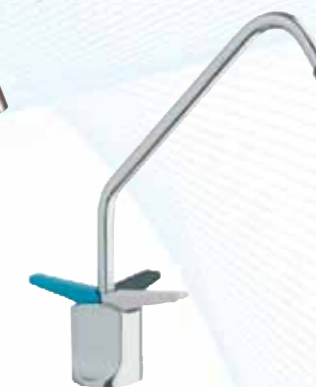
RUBINETTO IDRAULICO A 3 VIE