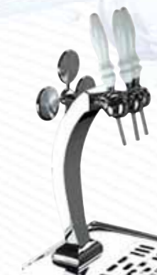
RUBINETTO IDRAULICO A 3 PULSANTI